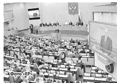
Фото местных отделений «Единой России».

На примере деятельности местных ЦПЗГ можно видеть реализацию важного и востребованного проекта «Единой России».