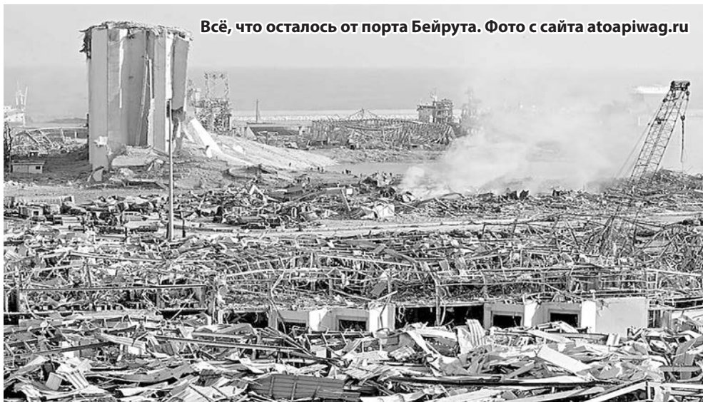
Всё, что осталось от порта Бейрута.

Порт Архангельска получил разрешение на перевалку и экспорт аммиачной селитры