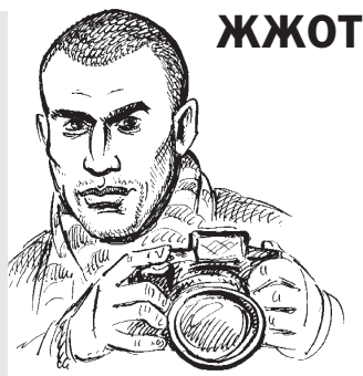
Тимати Травкин. Президент