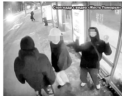
Стоп-кадр с видео «Жесть Поморья»

В отношении 15-летнего архангелогородца возбуждено уголовное дело за хулиганство с использованием оружия.