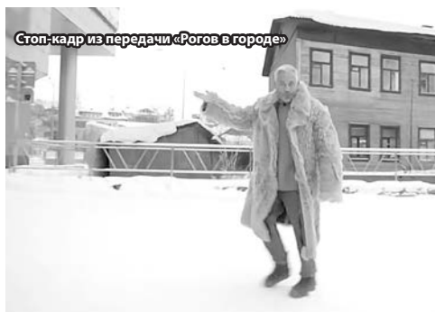
Стор-кадр из передачи «Рогов в городе»

всё: от Чумбаровки до еды в самых дорогих ресторанах города.