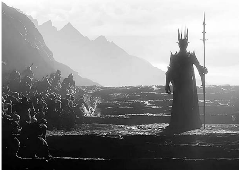
Стоп-кадр из сериала

ческим вопросам и, оказываясь, вольны сами выбирать себе лидера.